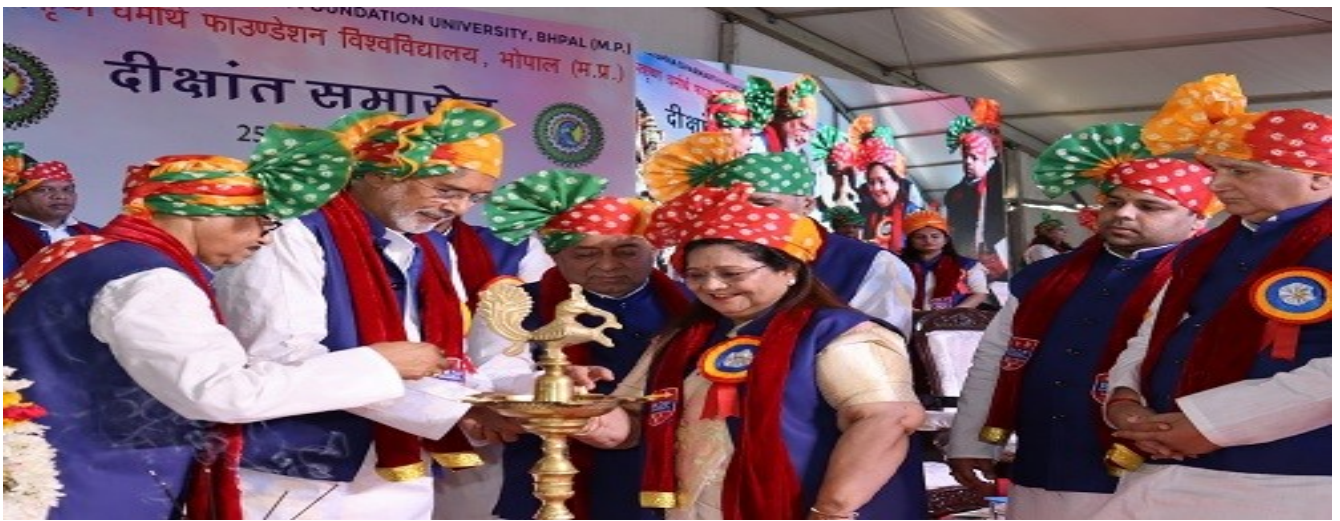
Convocation 2023 – Chief Guest Nobel Prize Winner Shri Kailash Satyarthi Ji