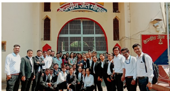
Central Jail Visit by RKDF Law Students