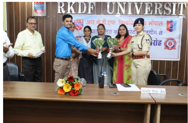
National Unity Day