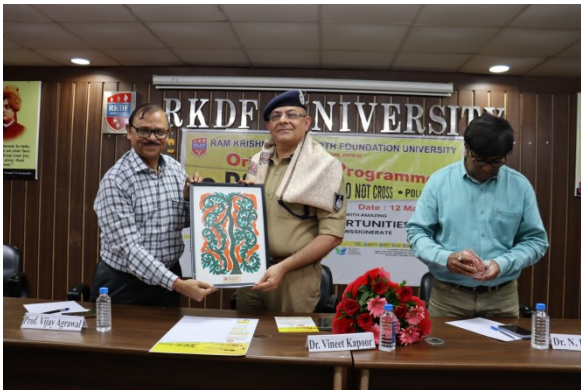
Seminar on Internship Opportunities with MP Police