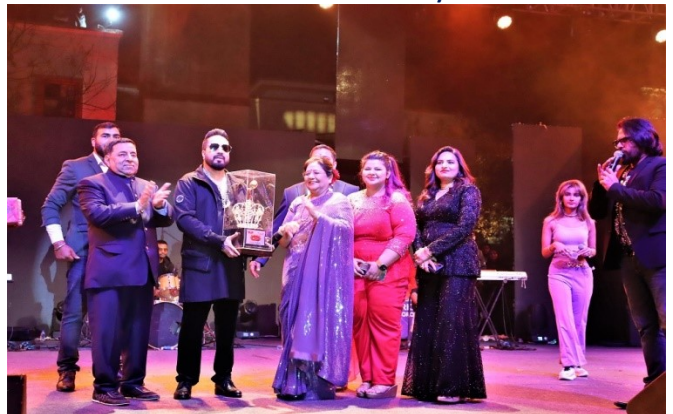
RKDF Foundation Day