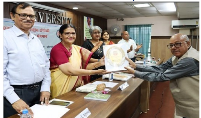
Seminar on Gender Discrimination