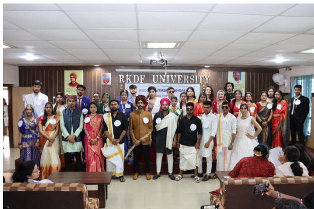
Vidhi Mohotsav Fancy Dress Competition