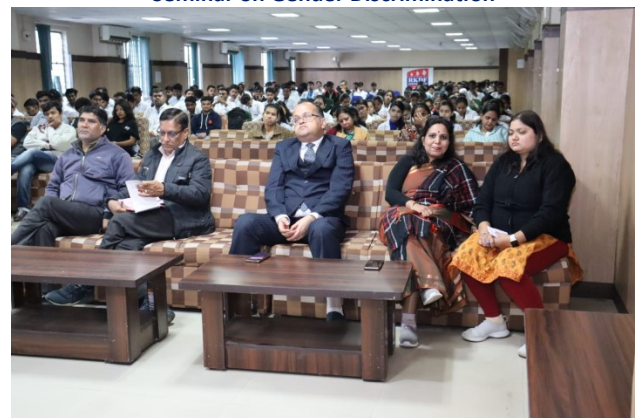
Seminar on National Interest of Youth