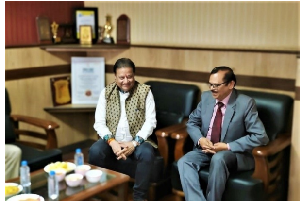
Shri Anoop Jalota in Campus