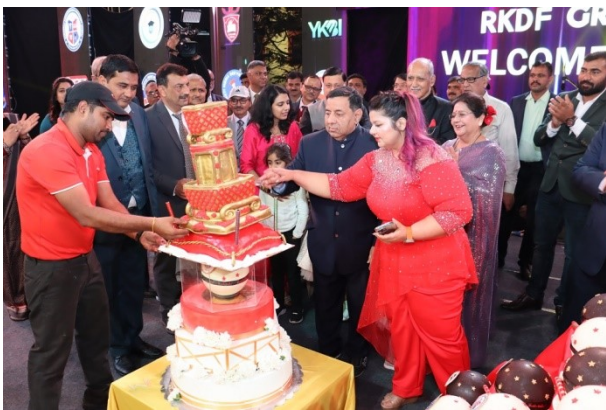
RKDF Foundation Day