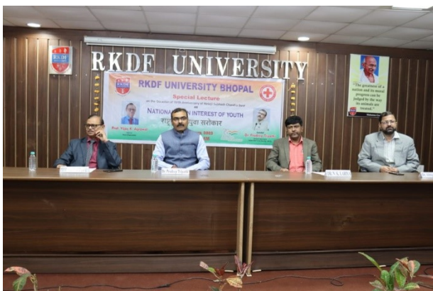
Seminar on National Interest of Youth