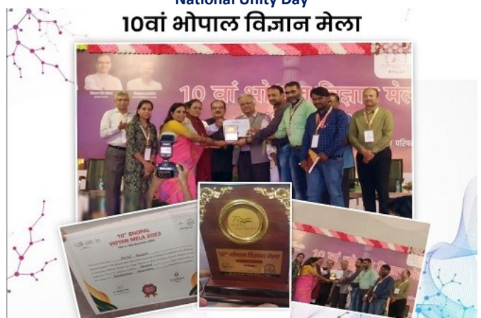
Vigyan Mela, 2023