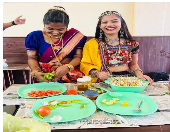
Food Festival – Flameless Cooking