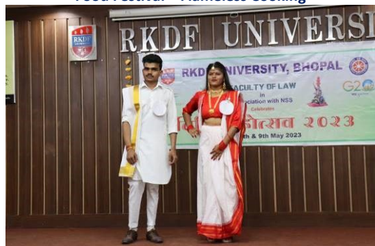
Vidhi Mohotsav Fancy Dress Competition