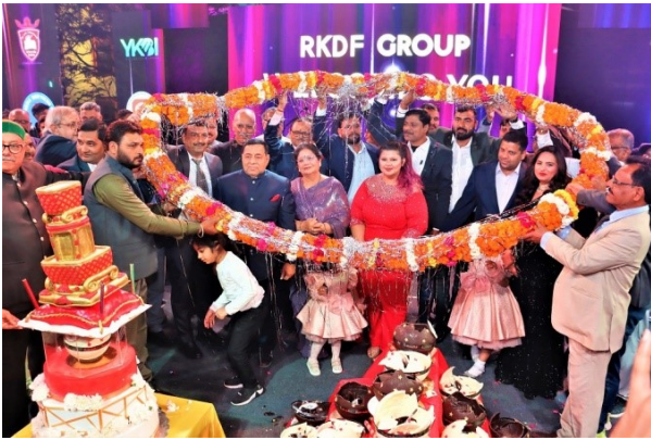
RKDF Foundation Day