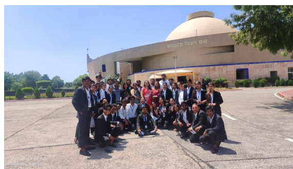
Visit to MP Vidhan Sabha