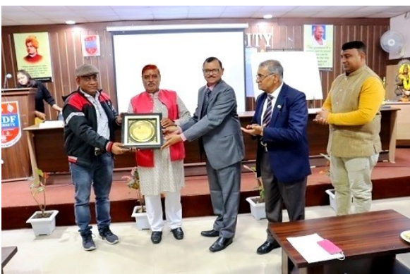
Seminar on Vedic Mathematics