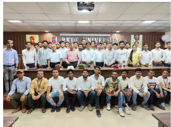
Farewell to Engineering Department