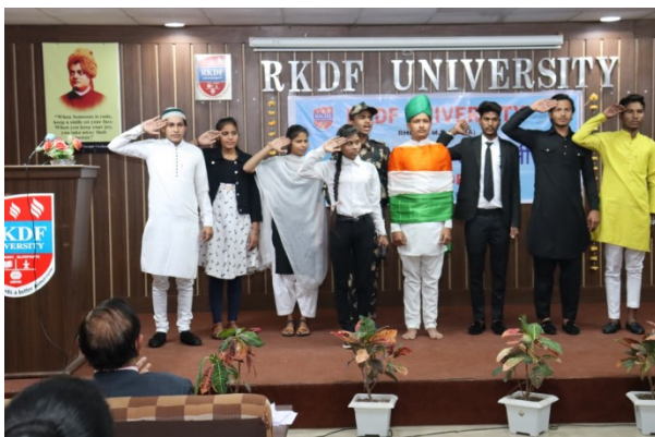
Aazadi Ka Amrit Mahotsav