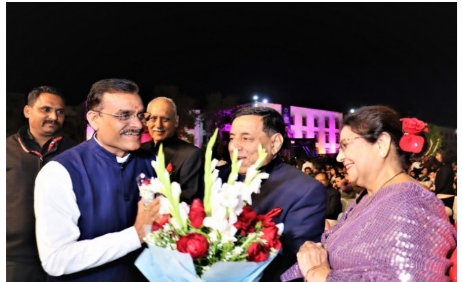
RKDF Foundation Day